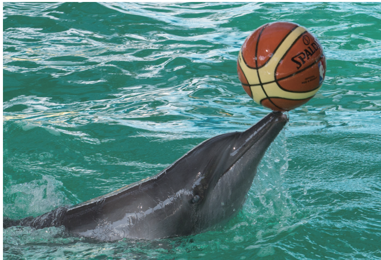
下图： 海豚被圈养在小水池中，游客可以与它们互动。

世界动物保护协会、动物福利学会及其他动物保护组织认为，有充分的信息可以清楚地证明海洋哺乳动物不能良好地适应圈养环境，无法在圈养环境中健康成长，而不仅仅是存活。为了人类的娱乐目的，从野外捕获动物或人工圈养繁育动物，不仅给动物个体带来痛苦，还会引发严重的道德问题。海洋哺乳动物被剥夺了自由，圈养环境所造成的充满压力的生活与其原本在野外自由进化和适应的生活完全不同。此外，公众展演的保护和教育价值并不成立。该报告得出的结论是，在全球范围内出于公众展演目的圈养此类动物是不可接受的。对于海洋哺乳动物——例如鲸豚类动物，其智力至少可以与类人猿或人类幼儿相当（它们具有自我意识以及抽象思维能力）——圈养生活根本就不是生活。