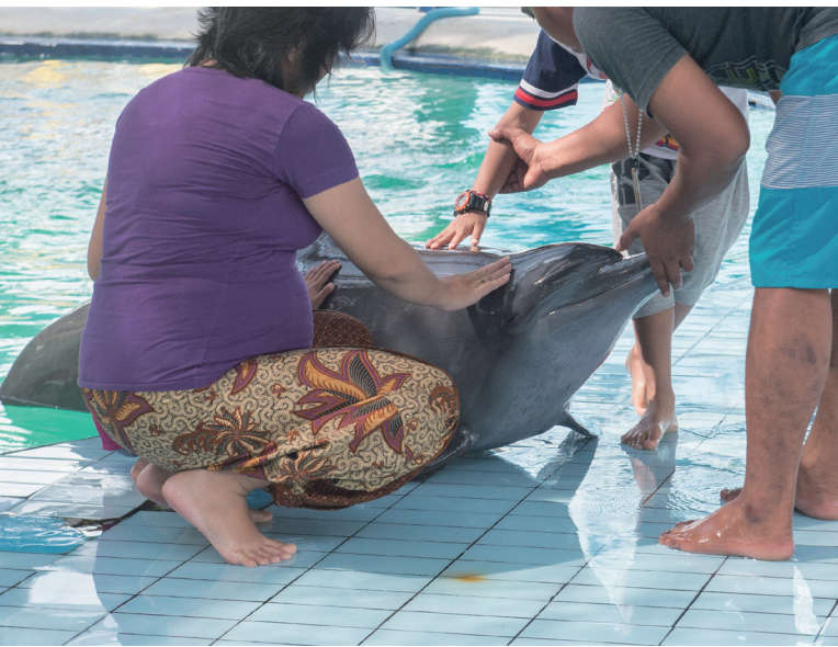
上图：海豚被圈养在小水池中，游客可以与它们互动。

公众展演行业往往声称海洋哺乳动物的展演是一项有价值的教育活动，人们可以通过观赏活体动物学到重要信息。然而一项研究表明，在调查中的海洋馆中只有不到半数为生态保护提供信息或为学生和老师提供教育材料。此外，观赏圈养动物会让公众对动物的自然生活习性有错误的认知。例如，海豚在展演中表演的很多动作被描述为“玩耍”和“快乐”，而实际上在野外自由生活的情况下则通常被认为是攻击性或骚乱的迹象。虽然教育是确保我们人道对待和保护与我们共享这个星球的无数其它物种最重要的方法之一，但世界动物保护协会坚信，观赏圈养海洋哺乳动物所导致的结果与该行业声称的保护教育属性恰恰相反：圈养野生动物非但没有使人们更关爱海洋哺乳动物和它们的栖息地，反而麻木了公众，使他们接受动物被捕获并带离其栖息地、圈养在非自然的狭小围栏中所承受的痛苦。