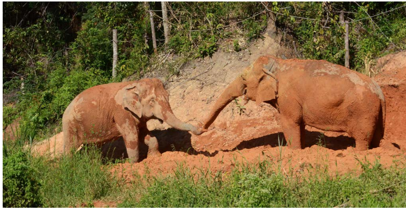
上图：ChangChill 景点转型后，生活在其中的大象可以自由地活动，展现自然行为。

不再允许游客与大象进行直接接触互动活动，因此大象的行为不再需要为了工作和娱乐游客而受到严格控制，大象的身心得以放松。无论是否有游客参观，大象每天都将确保有充足的时间可以在营区内接近野外生活环境的林地中自由地活动，表达其自然行为。