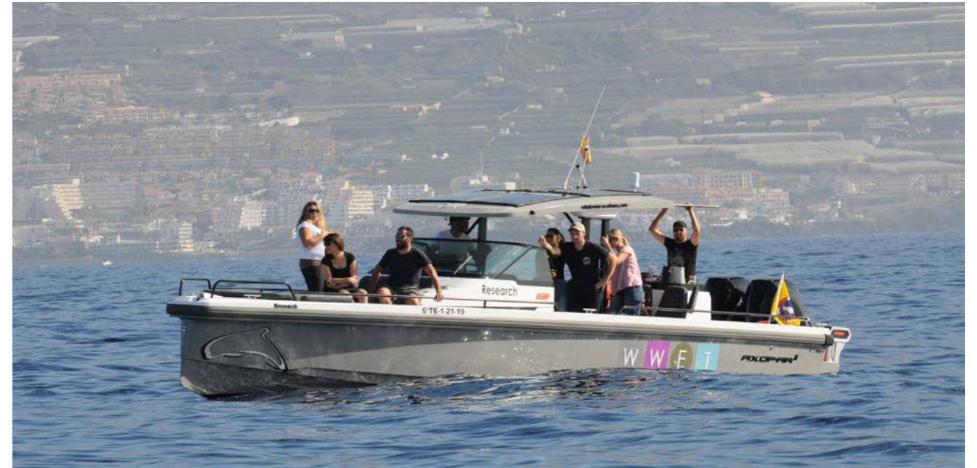
上图：游客在观鲸船上的体验。