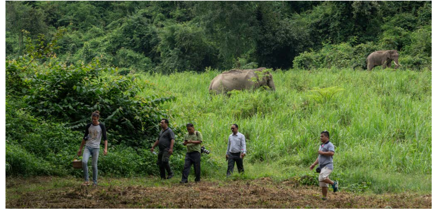
上图：来自尼泊尔的大象所有者正在考察泰国的大象友好型旅游景点，考虑将这种模式用于本地大象旅游社区的转型。

与此同时，年轻群体(85后与90后)正逐渐成为旅游市场主力。在中国，近9成年轻消费者认同更加贴近自然的旅游理念和方式，近80%的年轻消费者已经参与过友好型的动物旅游活动 19 ，85%以上年轻消费者都反对造成动物伤害的旅游活动。相较于上一代，野生动物友好型的旅游活动更加受到年轻群体的欢迎。因此，可以预见的是，消费者对野生动物友好型旅游活动的偏好趋势在未来将会持续加强。