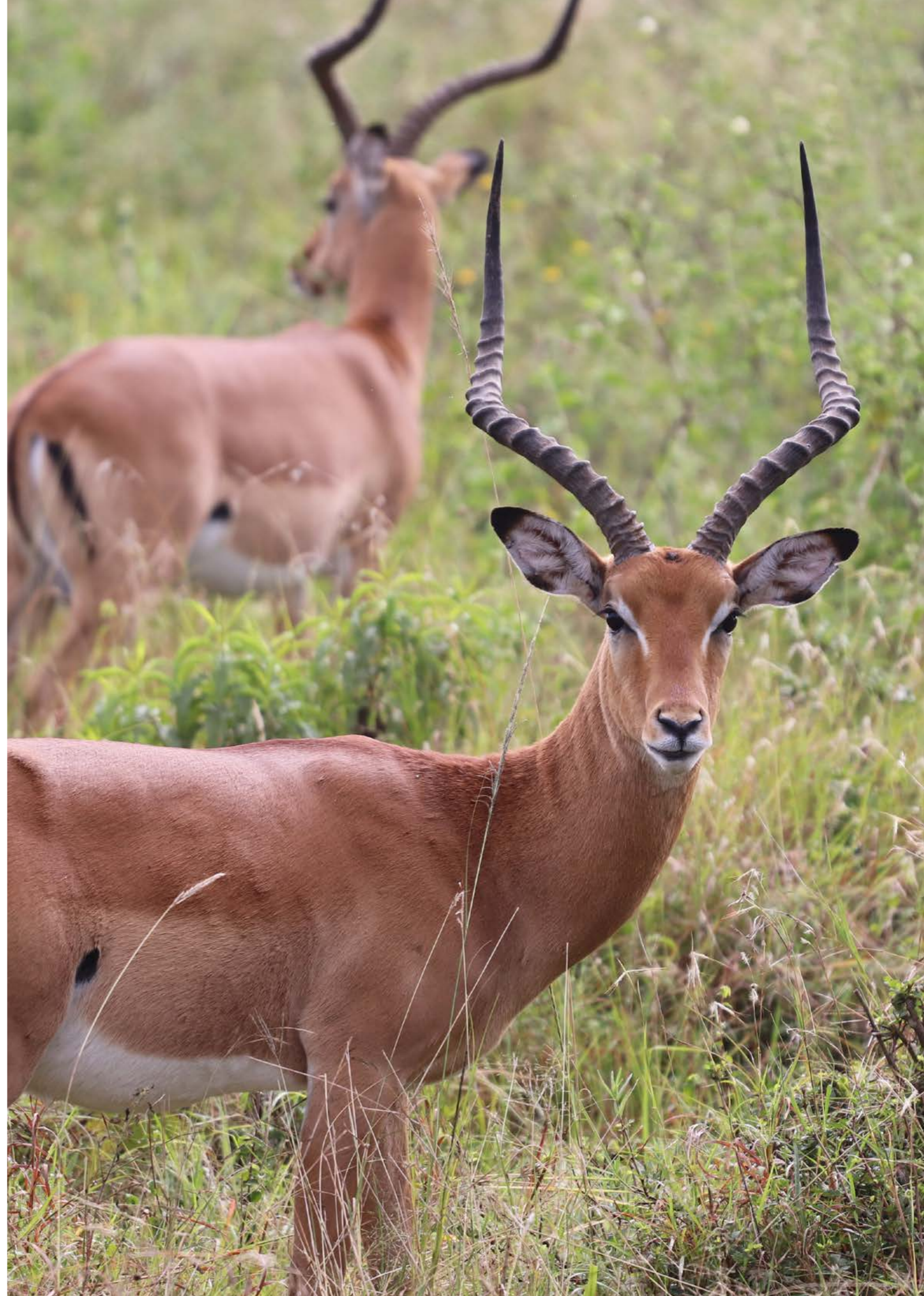
右图：非洲内罗毕国家公园的黑斑羚

截至目前，WWET 在旅游平台上没有收到任何“不满意”的反馈，收到的所有评级均为“五星”。来自游客的正面反馈和推荐，使 WWET 在游客间的口碑不断提升，越来越多的游客期望参与 WWET 的观鲸活动。一些当地酒店也因为受到游客的推荐，希望能与开展 WWET 合作。