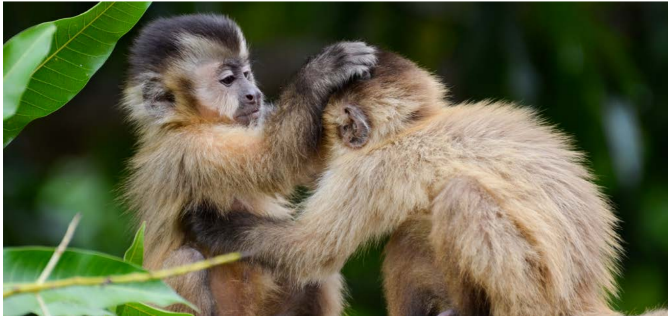
上图：南美的一个自然风景区内，生活在野外的两只幼小的卷尾猴正在对方身上寻找虱子。