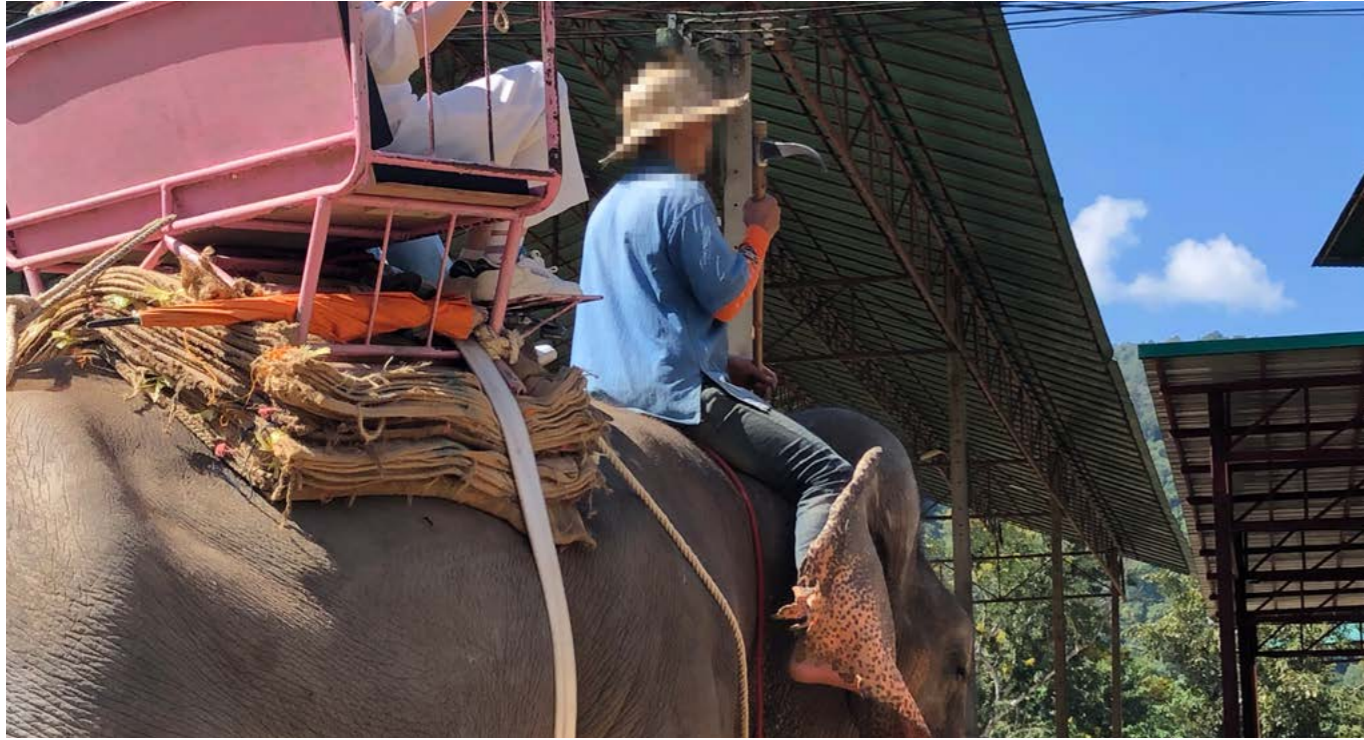
上图：东南亚用于游客骑乘的大象。长期以来，有记录表明一些大象和照顾它们的象夫都患有结核病，在游客与大象亲密接触时，人畜双向传播的结核病菌存在为双方带来感染风险的可能。