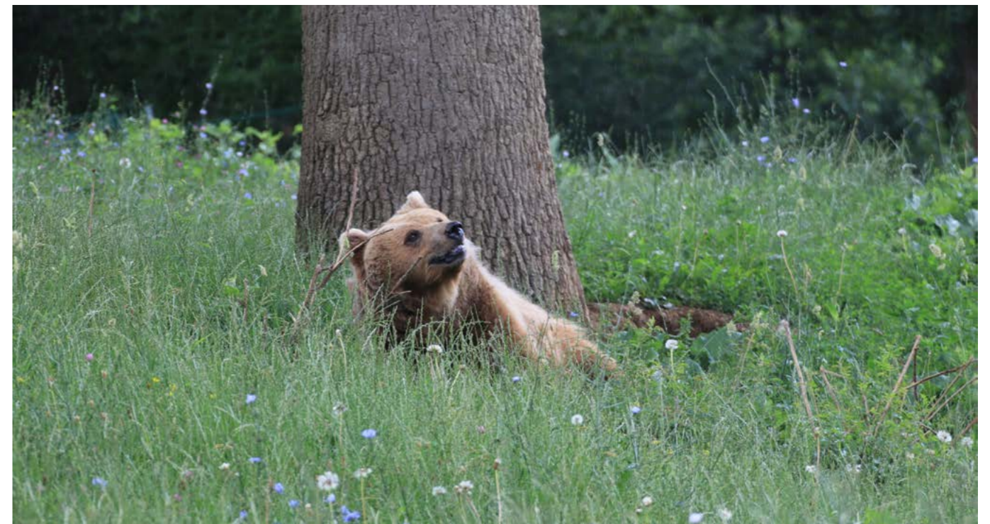
上图：被解救出的棕熊在庇护所中放松的生活。

2020 年在全球范围爆发的新型冠状病毒肺炎疫情同样影响到了庇护所，受到旅行限制的影响，疫情期间庇护所不再向公众开放。但庇护所目前正在通过实时网络摄像头，在视频网站上对庇护所內的部分场所进行播放，观众可以通过网络直播的形式观看到棕熊在庇护所內休憩、玩耍。此外，庇护所还正在开发“虚拟参观”服务，将通过与科技手段的结合，让观众在家中也可以体验到身临庇护所现场参观的感觉。庇护所也计划在未来与当地酒店进行合作，促进酒店游客前往庇护所进行参观并接受有关野生动物的保护，同时在酒店內开展有关动物福利及动物保护的宣传教育活动。这些创新模式将帮助庇护所在自身接待能力有限的情况下，让更多的人以非亲临现场的方式观赏、了解野生动物，并参与到野生动物保护的活动中。