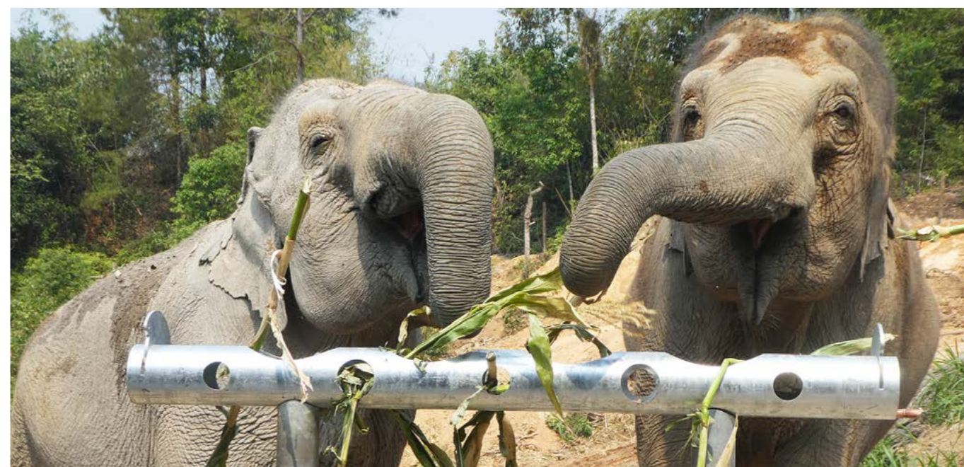
上图：ChangChill 大象友好型景点转型后，游客不再允许直接接触、喂食大象，但他们可以协助工作人员将补充食物塞入饲喂管，并在安全距离之外观赏大象进食。