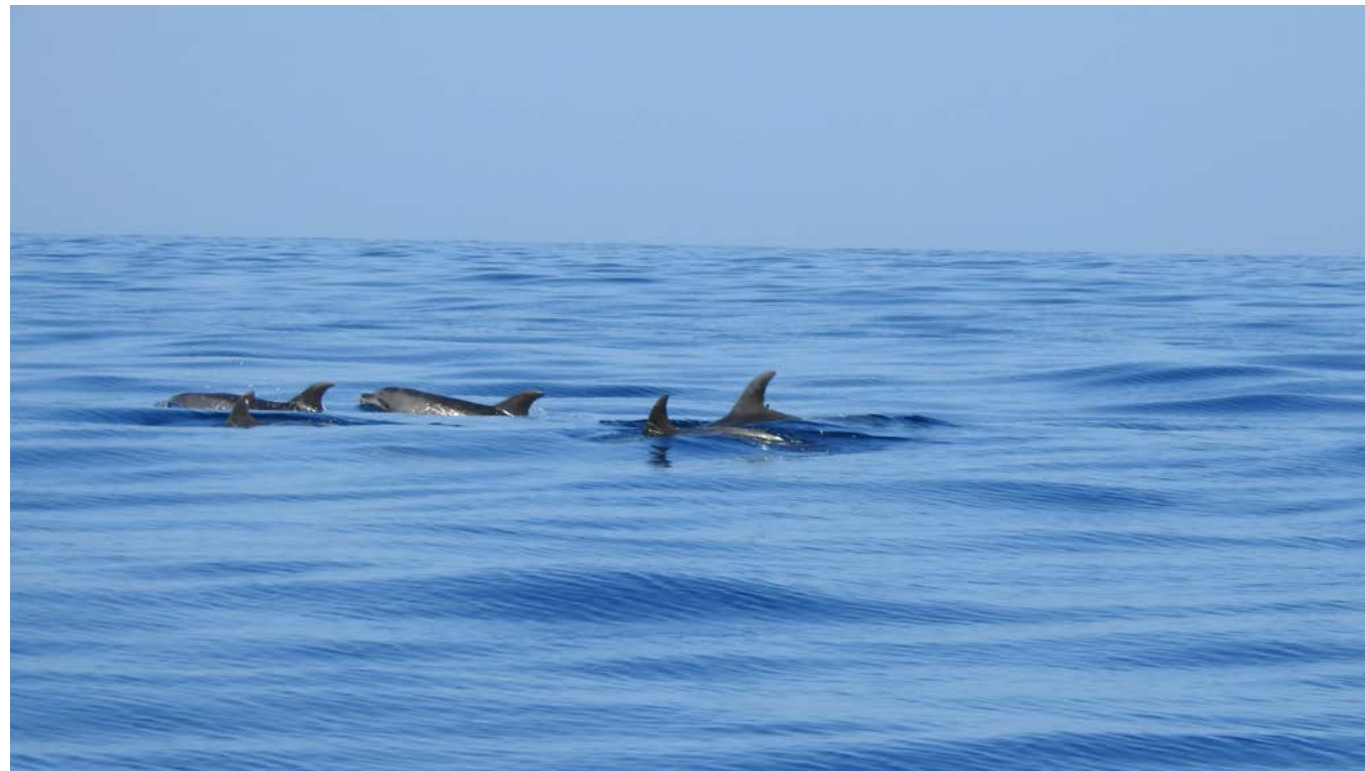
上图：西班牙特内里费岛观鲸。