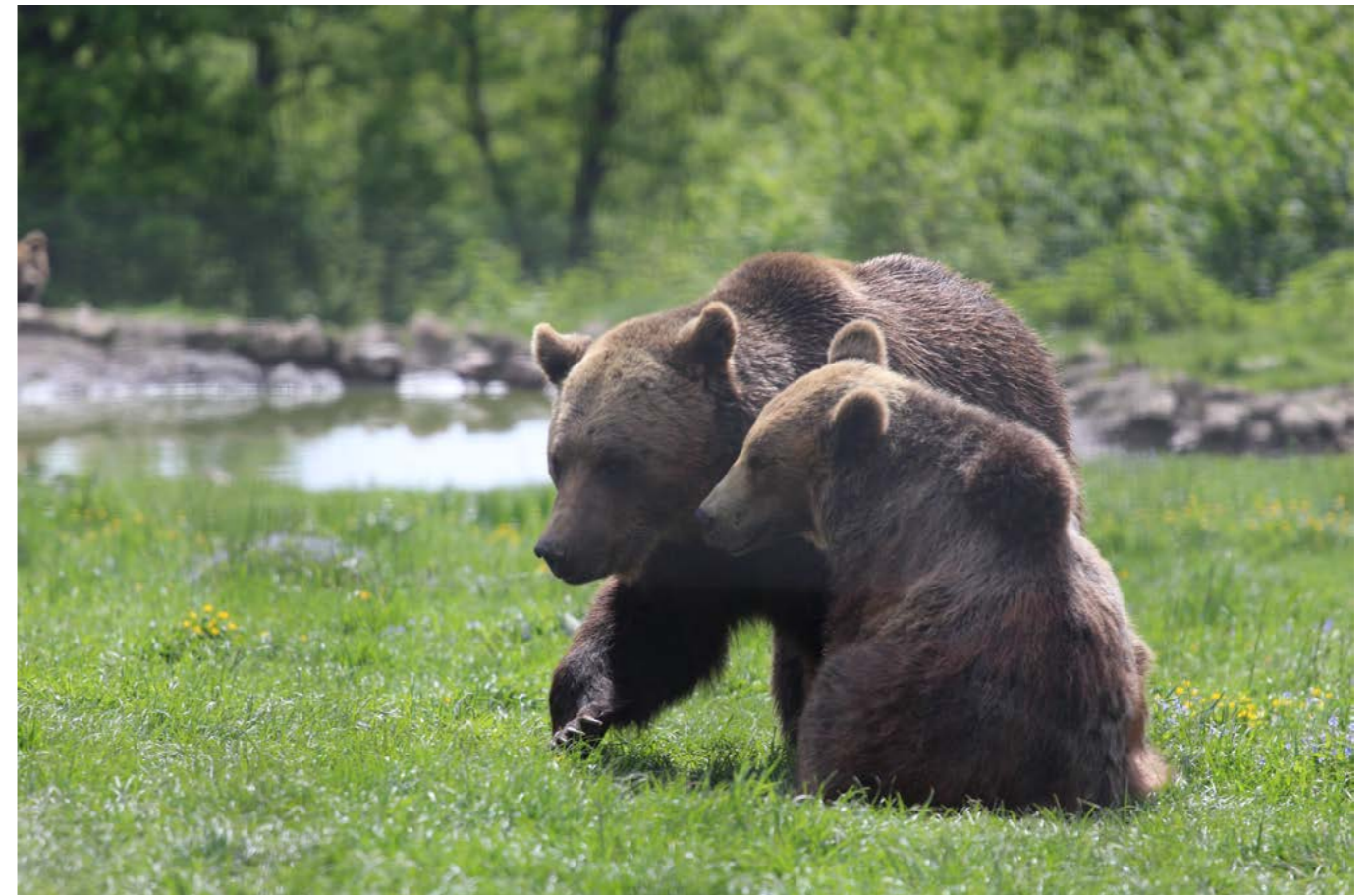
上图：截至 2019 年 5 月，罗马尼亚棕熊庇护所已经安置了大约 100 头棕熊。