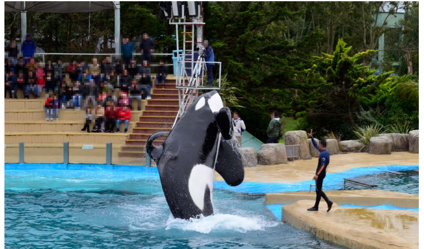
上图：正在表演的虎鲸。公众对圈养鲸豚的态度正在发生转变，许多国家已不再允许圈养鲸豚用于娱乐。

喜爱自然环境与野生动物，是大多数游客参与野生动物旅游活动的初衷，而不承担责任的野生动物旅游活动恰恰与其相悖。近年来，随着公众意识的不断提升，越来越多的人开始意识到动物娱乐活动给野生动物带来的痛苦和伤害。参与其中的企业受到强烈的道德谴责，企业形象受到打击。据统计，在揭露圈养鲸豚娱乐活动背后对动物造成严重伤害的纪录片《黑鲸》上映后，纪录片中所提及海洋馆受到愈发强烈的公众质疑，游客访问量大幅减少 13 ，并使得公司遭受了严重的经济损失，收入损失超过 8,000 万美元 14 。