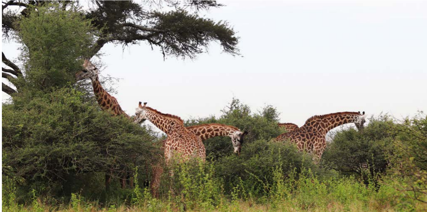
上图：非洲内罗毕国家公园，几只正在进食的长颈鹿。