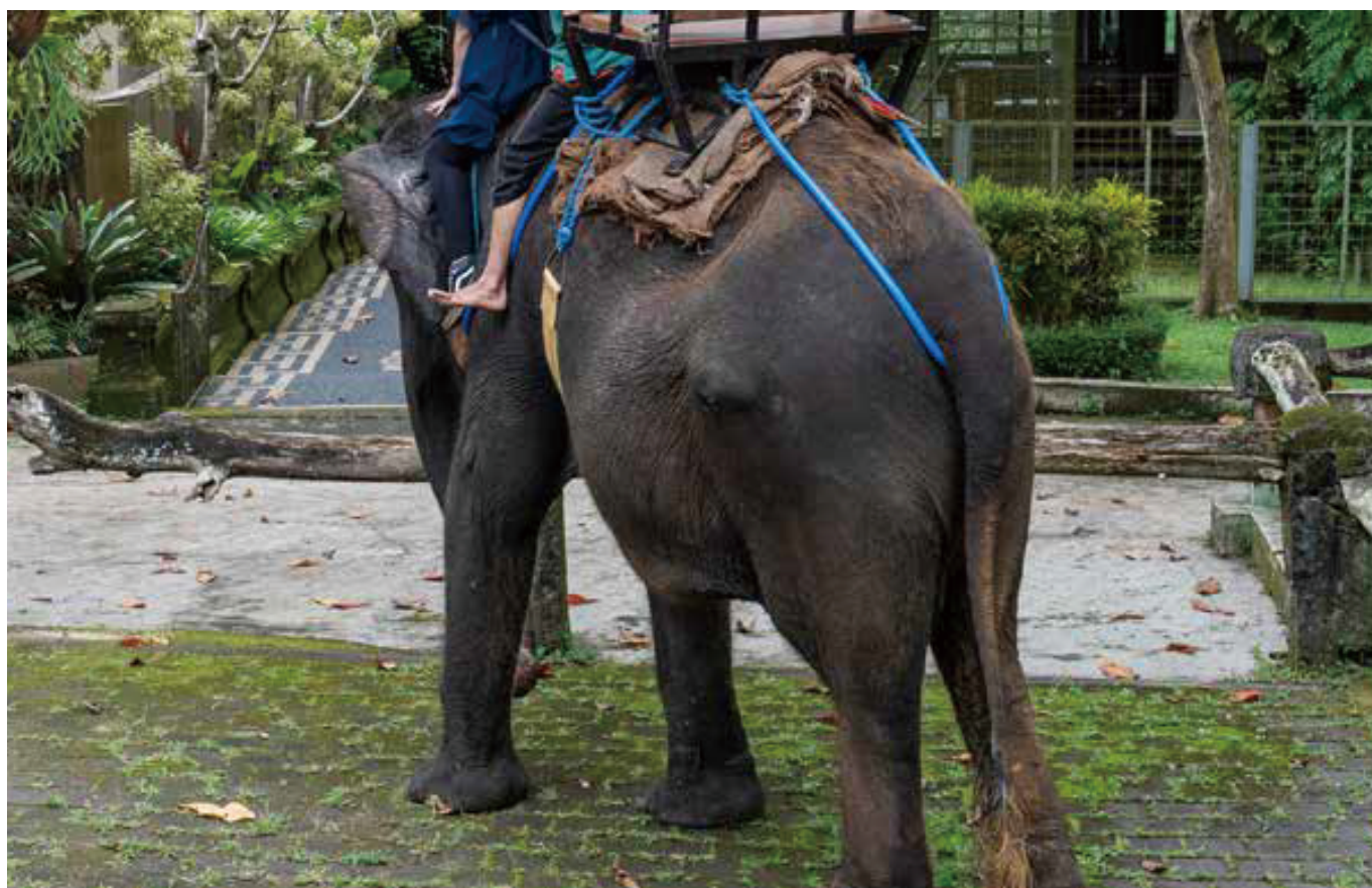
图片：巴卡斯大象公园的供游客骑乘的大象