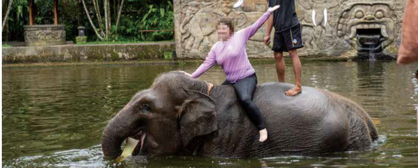
图片：梅森大象公园的与大象洗澡项目