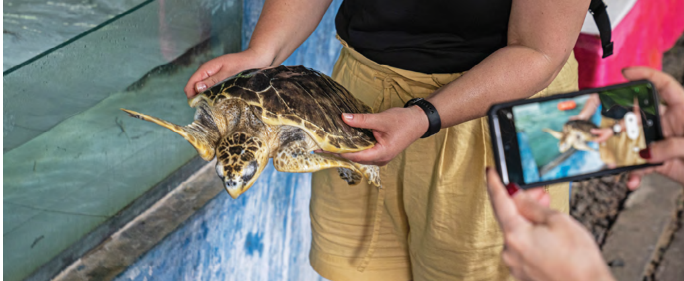
图片：海龟岛供游客自拍的海龟