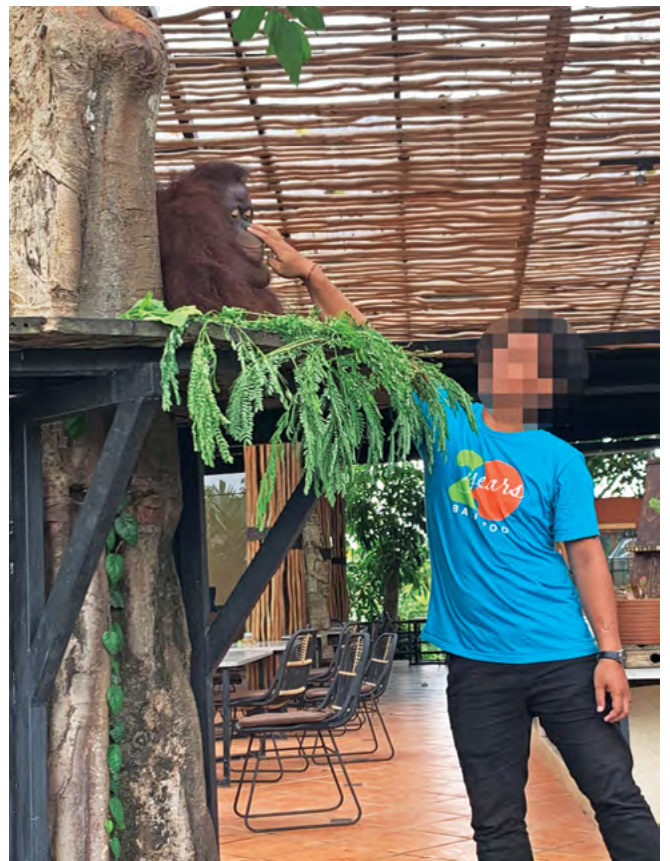
图片：巴厘岛动物园

本报告的调查结果仅仅只是印尼及东南亚野生动物娱乐场所的冰山一角。目前，该地区涉及多类动物娱乐项目的景点远不止于此。