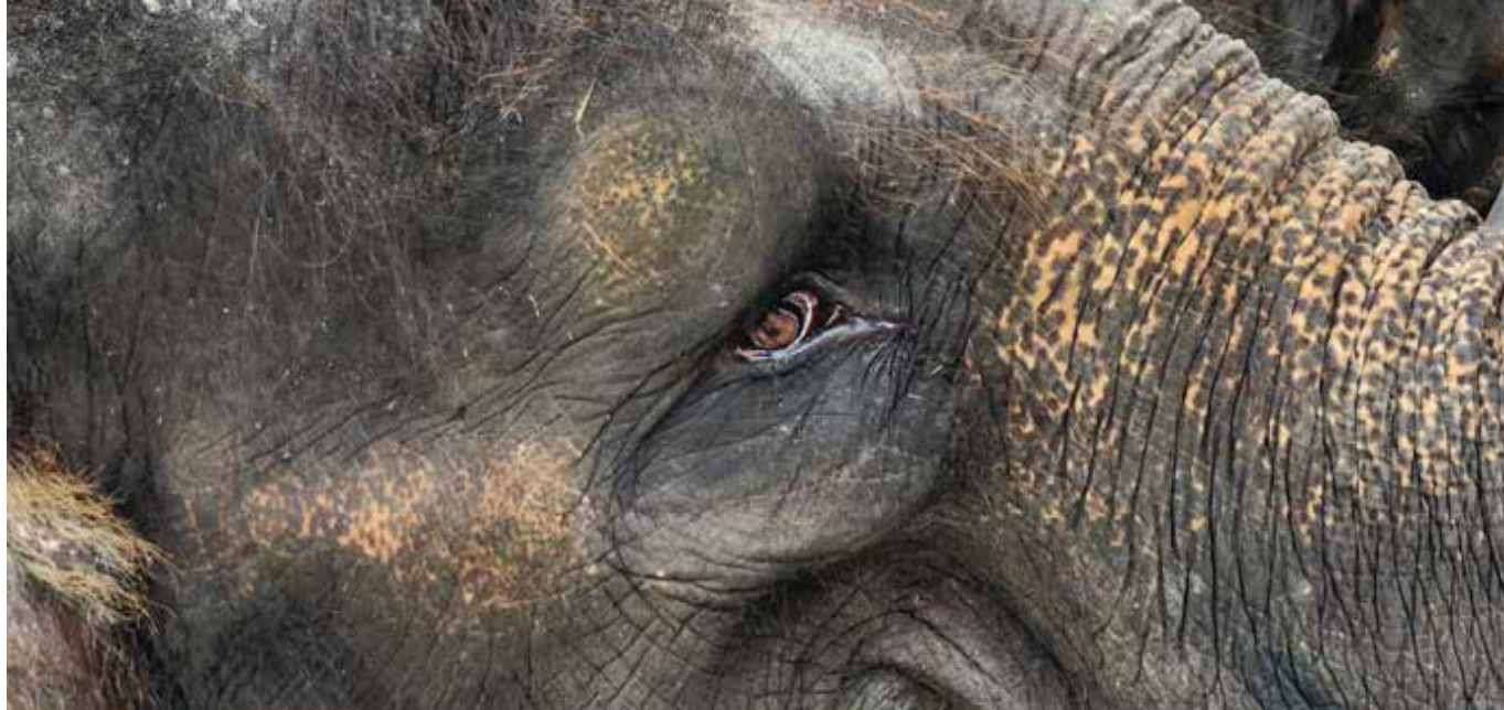
图片：巴卡斯大象公园的大象